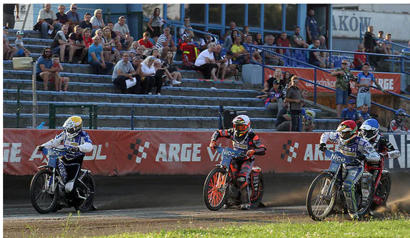
Na zdjęciu: Rywalizacja podczas Nice Cup